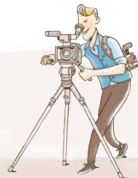
Film und Foto

Mikro + Repro AG Täferstrasse 28 5405 Dättwil